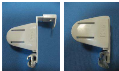
на "открывающуюся створку"